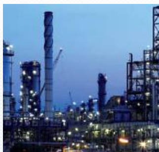
Montaje mecánico y eléctrico