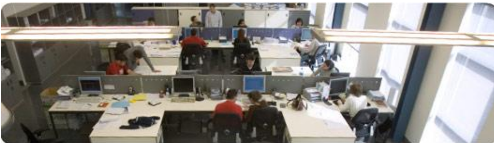
Ingeniería y Proyectos