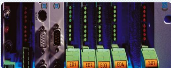
Instrumentación, Automatización y Control